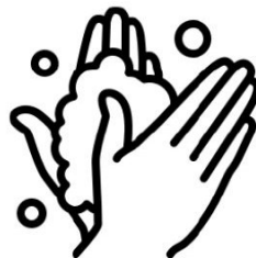
Waschen Sie Ihre Hände nach dem Husten oder Niesen