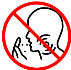
Mund und Nase beim Husten oder Niesen Abdecken. Beachten Sie die Hust- und Niesetikette