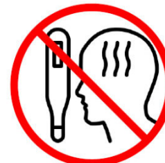
Gehen Sie bei grippeähnlichen Symptomen zum Arzt

Der Schießsport findet unter Beachtung des „Rahmenhygienekonzept Sport“ des Bayerischen Staatsministeriums statt.