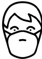
Tragen Sie eine Mund-Nasen-Bedeckung