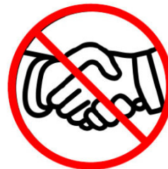
Verzichten Sie auf Umarmungen und Händeschütteln